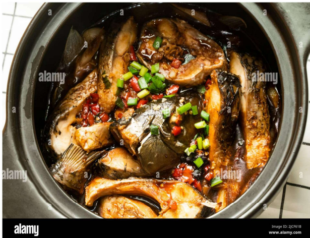
Photo : carpe épicée zao

Le Guizhou , quant à lui, est connu pour produire des piments marinés « 糟辣椒 zāolàjiāo, utilisés pour le poisson épicé zao ; il s'agit généralement de la carpe, un classique de la cuisine de cette province. Sans oublier le Boeuf séché du Guizhou 贵州牛干巴, Guìzhōu niúgānbā. Le boeuf est d'abord séché au soleil, puis fumé et découpé en fines tranches pour être finalement frit dans un mélange d'huile assaisonné de piment, de sésame et de poivre du Sichuan.