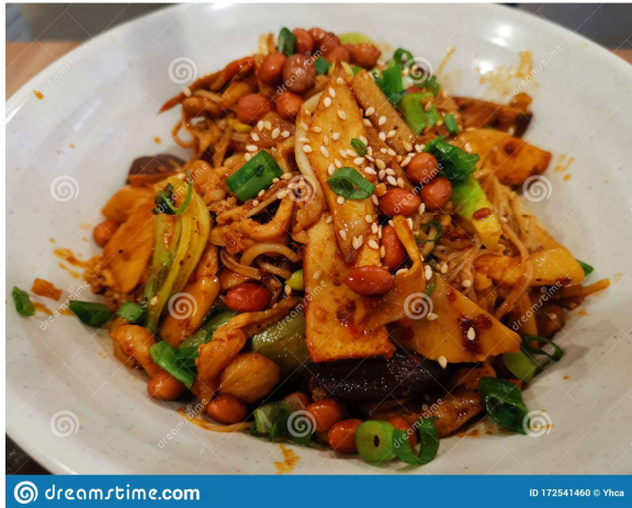
Photo : mala xiangguo Pot-au-feu sec mala

La saveur du Sichuan est dite « 麻辣 málà,( piquant et pimenté): une combinaison de piments et de poivre du Sichuan qui engourdit littéralement la langue! Comme par exemple le Pot-au-feu sec mala 麻辣香锅, málà xiāngguō, plat emblématique de l'ethnie des Tujia (土家), vivant dans les environs de la ville de Chongqing. On raconte que les Tujia n'ajoutent de la viande dans leur wok que lorsqu'un invité de marque prend part au repas!